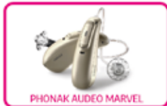
PHONAK AUDEO MARVEL